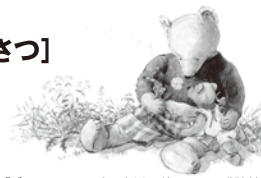
「ずーっと いっしょ」©市川里美 2002 講談社